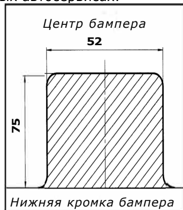
СХЕМА МОНТАЖА ТСУ